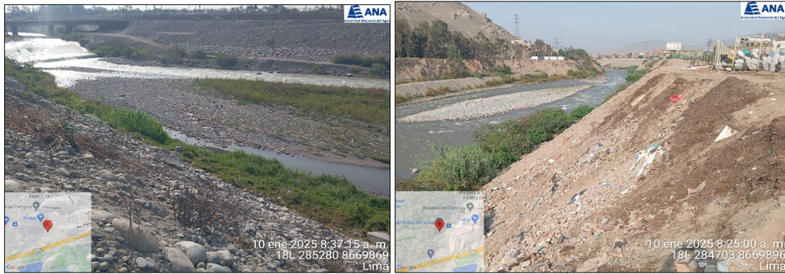
ZONA COLMATADA DEL RIO RIMAC